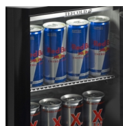
Предназначен для энергетиков в банках